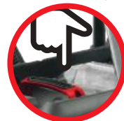
Oczyszczanie filtra / Filter cleaning