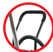
Składany uchwyt / Folding handle