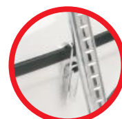
Metalowe zapięcia / Metal clasps