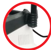
Przewód zasilający 5m / Power cord 5m