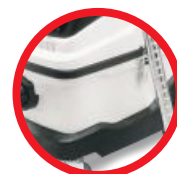
Obudowa z wytrzymałego plastiku ABS / Housing made from strong ABS material