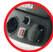
Pokrętko regulacji mocy ssącej / The suction power control knob