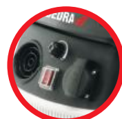
Gniazdo podłączenia elektronarzędzi 2,0kW / Power tools socket 2,0kW