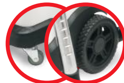
Małe, wytrzymałe, obrotowe kółka / Small, strong, swivel wheels + Duże kółka transportowe / Large rear wheels